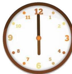
Entrada per sopar